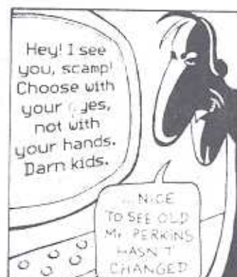
Illustration by Patrick Chappatte